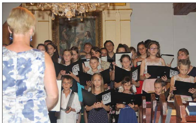
Csoportkép az őrimagyaródsdi templomból